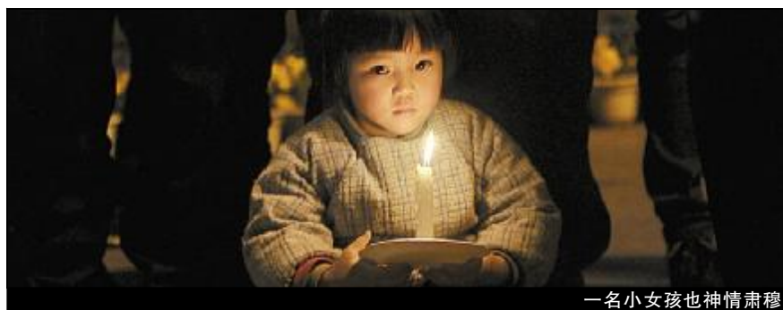
一名小女孩也神情肃穆

音乐声停止,市民久久不肯离去。今年66岁的布阿姨站在人群中颤抖不已,“他们是我们心中的英雄,今天他们回家了,我看了三次电视,每次都哭了。希望他们一路走好,他们是伟大的。”