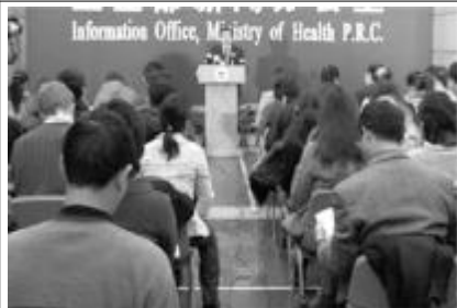
最近在医圣张仲景家乡南阳市, 一个能溶解结石彻底治疗结石的神秘古方惊现于